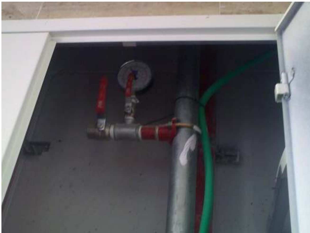
17. אין תמיכה למוני מים בקומת קרקע בלבד לסדר.