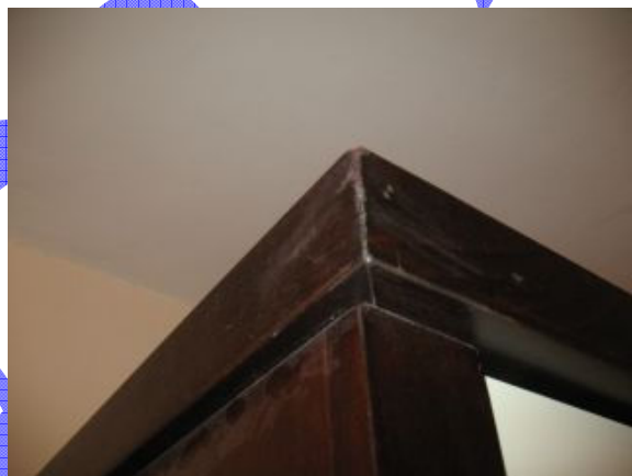
9. גימור לקוי בחיבור בין רכיבים עליונים המותקנים מעל יחידת ארון גבוה.