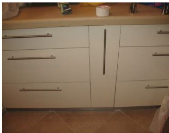
10. מרווחים בלתי אחידים בין עגלה לדלתות ארונות.