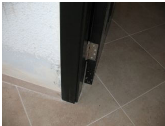
4. סדק בתחתית חלבה דלת כניסה ראשית.