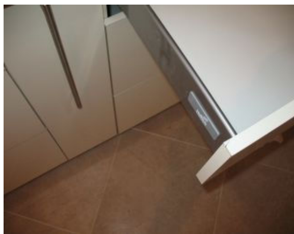
7. מגירה עליונה בארון תחתון ליד יחידת ארון גבוה: סדק בציפוי בשפת הפנל.