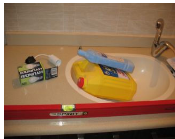
11. התקנה בלתי מפולסת של ארון בחדר רחצה כללי.