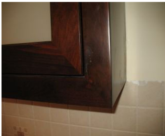
8. פגמים בחזית ארון עליון עם קלפה.