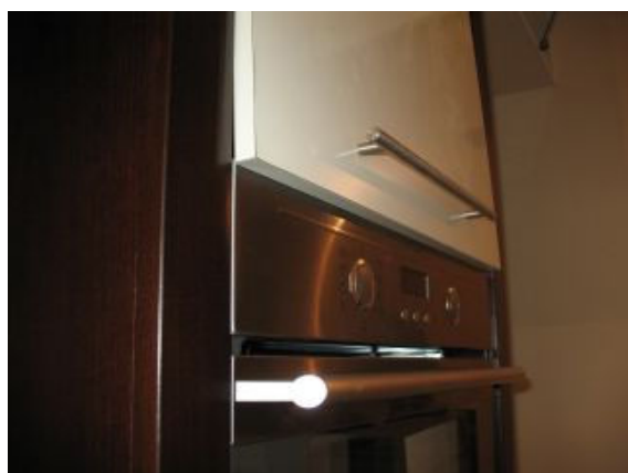
1. דלת ארון למיקרו לא נסגרת עקב מידות גדולות לעומת הנדרש.