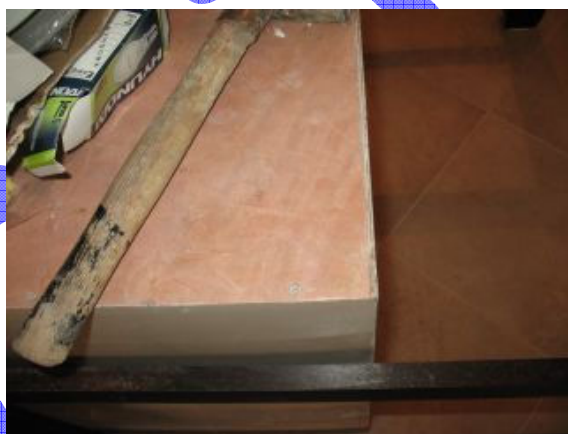
3. פגם בדופן אחורית של ארון אי לפינת אוכל.