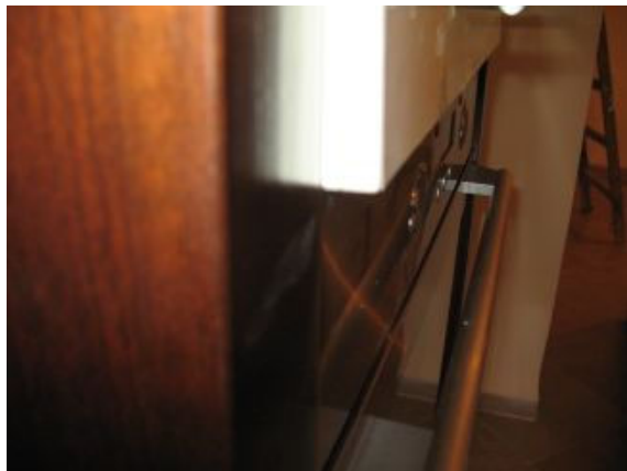
2. התקלפות ציפוי/קנט במקצועות דלת ארון מיקרו.