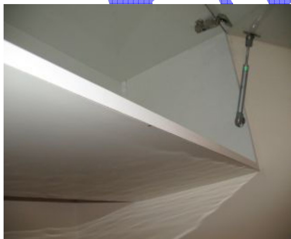
6. קילוף ציפוי בתחתית הארון המותקן מעל המקרר.